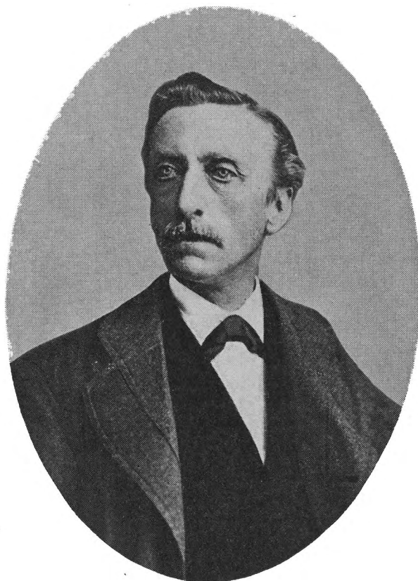
EDUARD DOUWES DEKKER