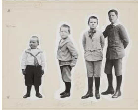
Menno ter Braak als opgroeiende jongen, montagefoto, 1906-1914